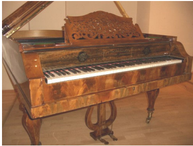
1839年製ベーゼンドルファー・ハンマーフリューゲル